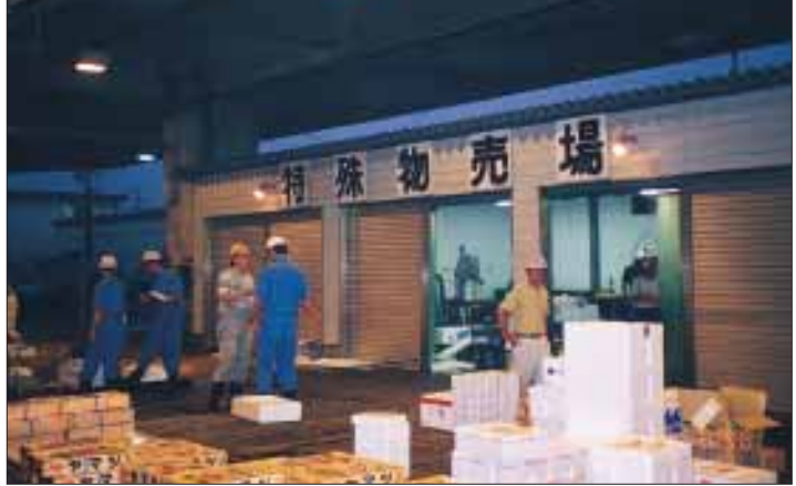
①設定卸貨、切割等設施及廢棄物、殘渣保管設施等基準。

理漁產品方面，重點放在提昇衛生品質管理的基本事項，如一般的衛生管理；而在個別之產地魚市場中，則因為地理條件的不同，對於產品的種類、數量、利用目的亦有差別，因此必須針對個別產地魚市場的特徵，規劃不同的衛生品質管理架構。